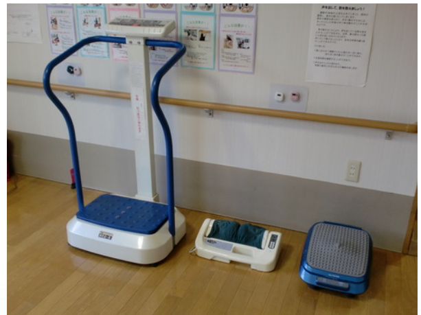
各種下肢マッサージ機

ワン・ツー！ワン・ツー！リズム良く左右の足に重心移動。歩行練習の動きをマシンが誘導してくれます。膝、腰への負担が少なく、歩く感覚を体感できます。