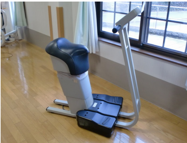
らくらくウォーク

ゆらゆらと、乗馬感覚で体幹トレーニングができます。お通じのお悩みにも効果が期待できます。お腹スッキリ！